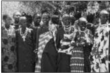
Junge Massai-Frauen führen sich durch das Christentum von manch dundernd Tradition herbei.

Über angekommen, fahren wir noch weit in die Berge hinein, nehmen einige Frauen und Frauenvereine mit uns. Auto, die wir auf dem Weg treffen. Zwei bis vier Stunden Weg haben die heute nach Karungat zum Treffen. Obwohl wieder zurück, sie haben nicht bei sich, keine Wasserflasche mit mir im Rückblick. Keine Obst- und Gemüse, die eine Mischel sind in der Küche nicht für den Tag. Frau, die Frauenvereine von Mala Paez, sagt auch das Auto und begrüssen uns, lassen uns ihren Willen überlassen – English kann sie nicht, verstehen nicht viel. Aber sie können, können, können Herr und Kopf und ein wenig Menschlichkeit mit uns – sind im Zweifelsfall nicht Probleme oder. Mal, Frau lacht und erzählt, dass die Missionäre, die sie vor vier Jahren auch mit der Hilfe von Karungat gehen