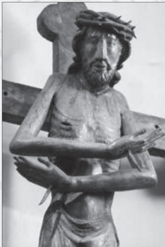
Kruzifixus in der Neumünsterkirche zu Würzburg, Mitte 14. Jahrhundert.