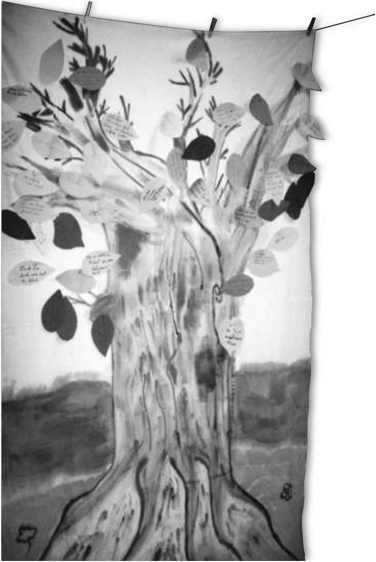
Wunschbaum, entstanden beim Schulanfangsgottesdienst im August