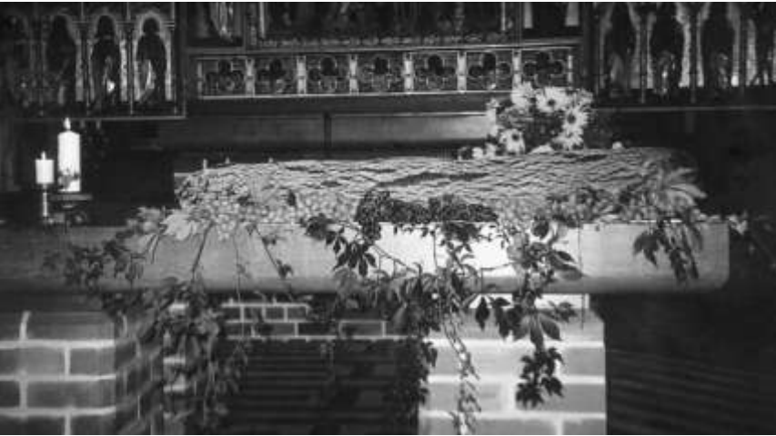
Brot wird von der Bäckerei Zander gespendet

Das Geld, das da zusammenkommt, teilen wir wieder zwischen unseren Partnergemeinden in Kasachstan und Tansania.