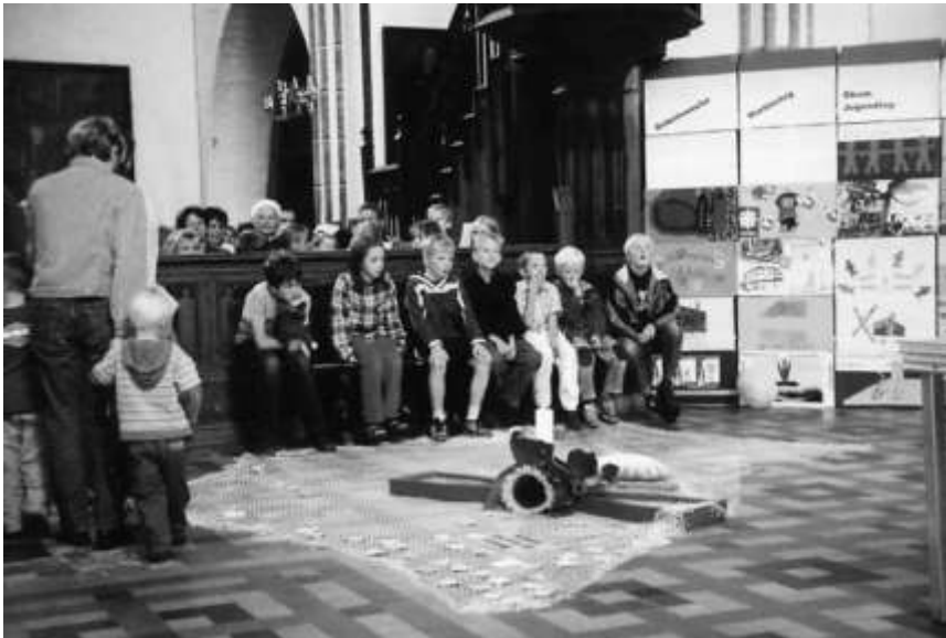
Ökumenischer Gottesdienst im Dom

Die Nacht klang aus mit Musik und einem Nachtmahl – Brot, Wein, Saft und Weintrauben standen für uns bereit.